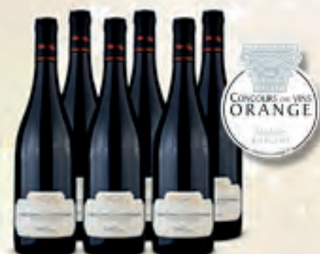
AOP Grignan-les-Adhémar 2019 Villa d'Erg