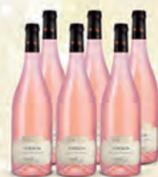
AOC Lubéron 2020 Villa d'Erg