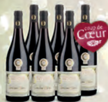
AOP Côtes-du-Rhône 2016 & 17 Héritage Cavare